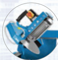
Schwenkbarer Sägekopf ermöglicht 45° Gehrungsschnitte