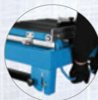
Klappfüße, Transporträder und Tragegriffe für beste Manövrierbarkeit am Einsatzort