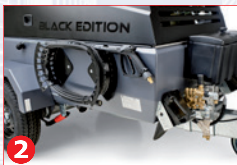
2 Integrierter Hochdruckreiniger, hydraulisch angetrieben