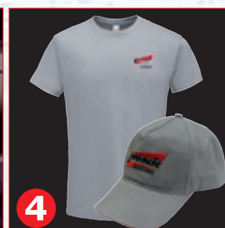
4 3 x Lorencic T-Shirt 3 x Lorencic Kappe