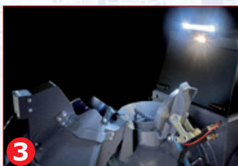
3 Arbeitsscheinwerfer LED