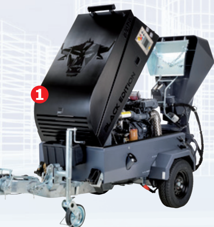
1 Sonderlackierung BMS alpha CR BLACK EDITION